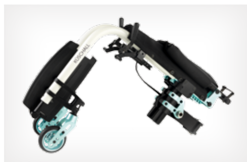
Tamaño de transporte con chasis estándar