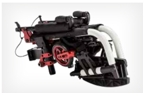
La silla transportable más pequeña del mundo