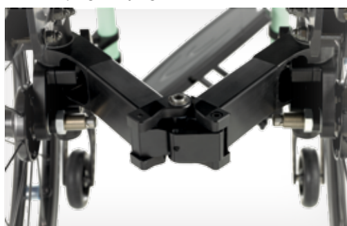
Mecanismo de plegado horizontal único