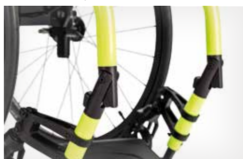
Parte delantera del chasis plegable (+480 gr) - Opcional