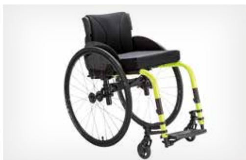
Una silla plegable y rígida a la vez